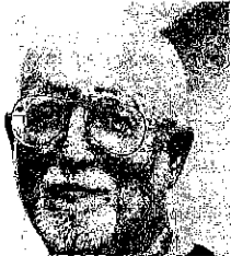
'Het podiumvak kun je niet leren zonder discipline.'